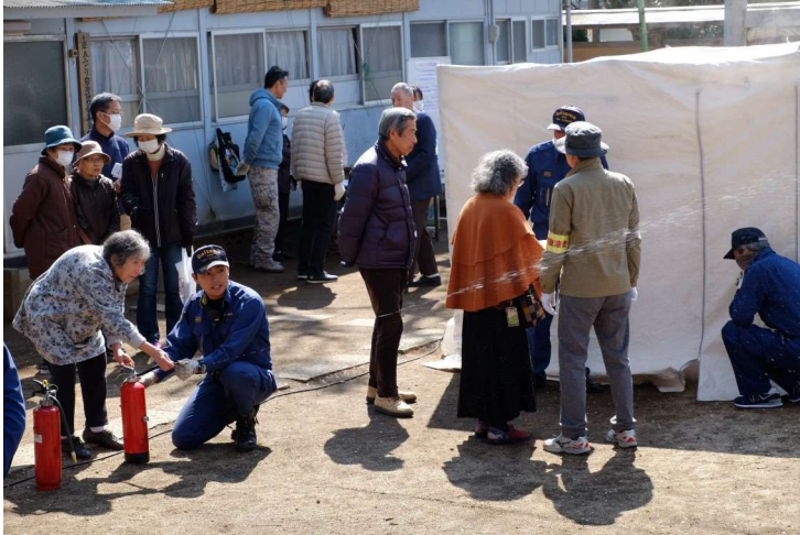
消火器の実射や煙避難の体験