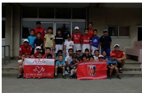
レッズハートフルキャラバンサッカー教室