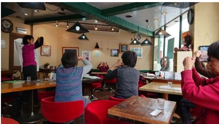
毎月第4水曜日14時から16時まで 「喫茶まりも」で開催しています。予 約は不要です。