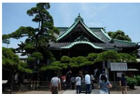
柴又帝釈天ウォーク